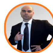
Patrick SENAT TOULOUSE (31500)